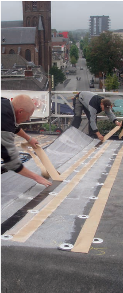
Stap 2: verwijderen van de tape op de zelfklevende strook.