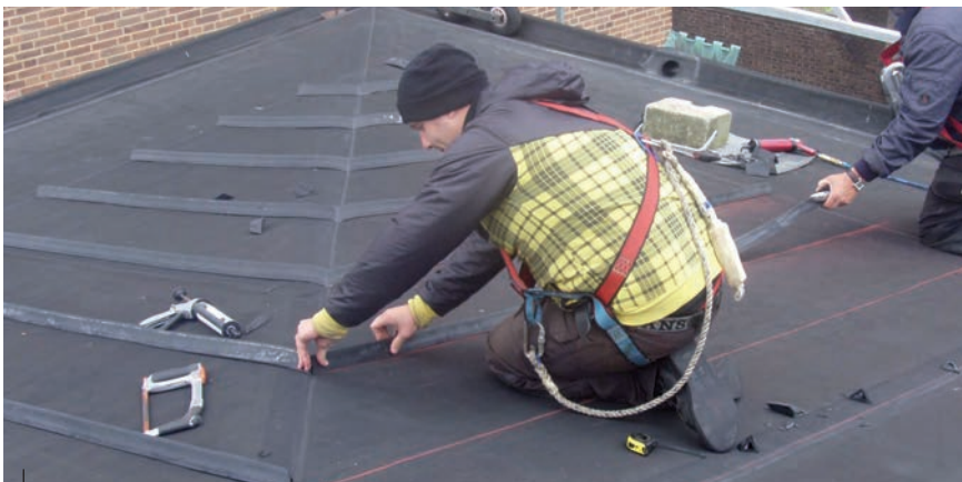
Lijmen van de driehoekige roeven op een dakvlak met normale EPDM-dakbanen.

Een renovatie was dus geen overbodige luxe. Nadat dit besluit was genomen, besloot het gemeentebestuur 'groen' te investeren. Men wilde een duurzame, nieuwe dakbedekking waarmee tevens energie was op te wekken.