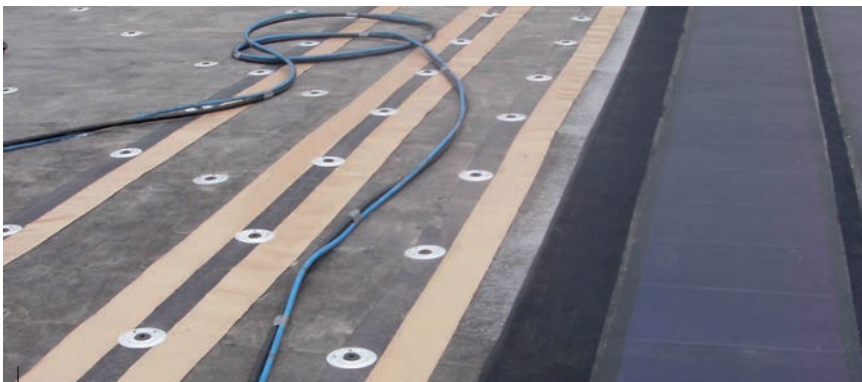
Als extra borging zitten onder elke solarbaan zelfklevende plakstroken, die mechanisch zijn bevestigd.