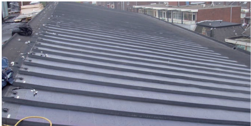
Overzicht van een dak met de Solar dakbanen en roeven.