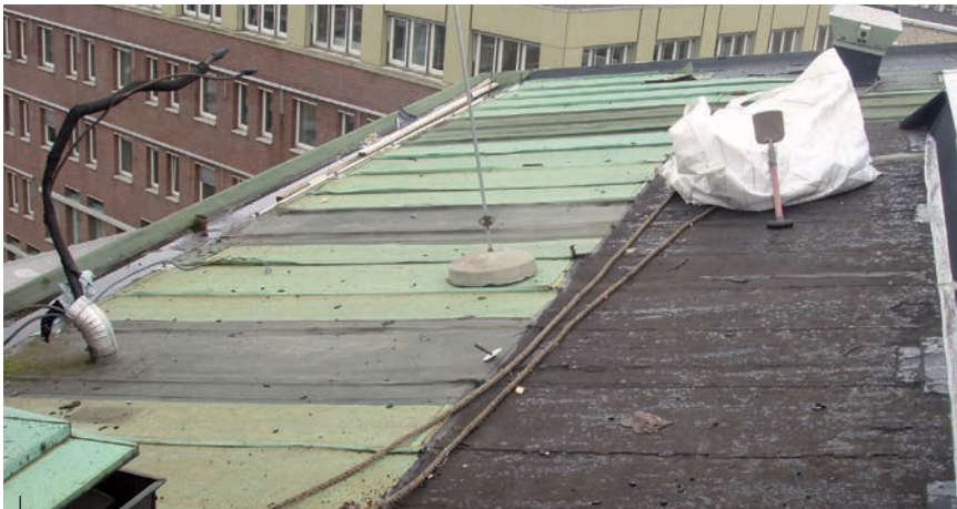
De oude bedekking bestond uit een bitumen dakbaan met een koperen toplaag met roeven; de toplaag is eraf gekrabbd, de bitumen dakbaan doet dienst als dampremmende laag in de nieuwe opbouw.