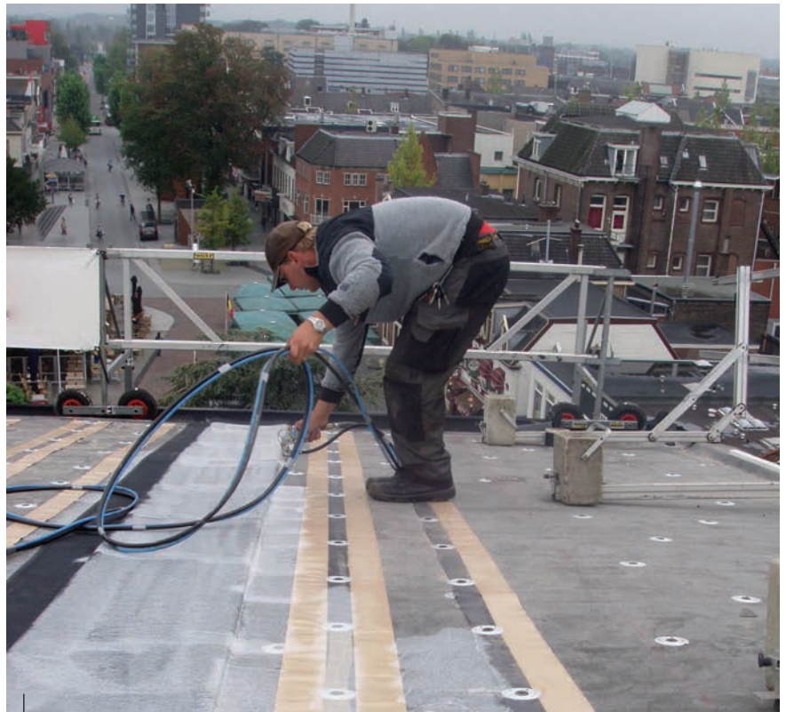
Stap 1: aanbrengen van de lijm. De onderzijde van de dakbanen is vooraf geprimerd.

EuroStyle EPDM Solar wordt geleverd als dakbaan van 5,65 x 1,50 meter met een dikte van 1,5 mm: een extra kwaliteit, want een gangbare EPDM-dakbaan heeft een dikte van 1,14 mm. Door hun flexibiliteit en hun relatief geringe gewicht zijn deze dakbanen zonder aanvullende constructieve maatregelen op bijna elke dakvorm aan te brengen. In Hengelo is de oude bitumen dakbedekking, geplakt op houtvezel betonnen dakplaten, blijven zitten als dampremmende laag. Alleen de koperen toplaag is eraf gekrabd. Dat ging met koud weer heel goed, maar op een warme dag werd er wel eens iets meegetrokken van de onderlaag. Deze plekken zijn eerst gerepareerd met een bitumen bedekking, voordat men met de nieuwe opbouw begon. Op de oude bedekking zijn allereerst gerecyclede platen EPS 150 van 80 mm dik gelegd. Deels zijn er ook platen resolschuim gebruikt voor een betere isolatie, zoals op de dakvlakken boven de kantoren.