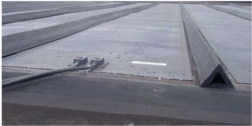
De roeven zijn tussen de solarbanen aangebracht.

Om een enigszins authentiek aanzien van de daken terug te krijgen, is er zoals al eerder aangehaald, met roeven gewerkt. Deze roeven van EPDM-rubber hebben een driehoekige doorsnede met gelijke zijden van circa zestig millimeter. Ze zijn verlijmd op de dakbanen. Bij de dakbedekking met de amorfe siliciumbanen tussen deze solarstroken en bij de normale dakbanen op dezelfde h.o.h.-afstanden om het beeld identiek te houden. Een ander opvallend detail is dat de afmetingen van de normale EPDM-dakbanen voor de andere dakvlakken zijn afgestemd op die van de solarbanen. Verder zijn op de dakvlakken met een normale bedekking aan de voet en bij de nok horizontaal gerichte banen geplakt en daartussen verticale banen; ook dit weer om het patroon en het beeld van de aangrenzende dakvlakken gelijk te houden. Daarnaast is het bijzonder dat in Hengelo de doorschakeling van de stekkers van de amorfe stroken worden weggewerkt achter de dakkappen van de verschillende dakvlakken. Normaliter is daar een speciale dakgoot voor nodig. Het installatietechnische werk,