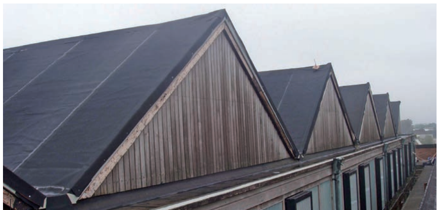
Op het middendeel van het dak liggen enige op elkaar aansluitende zadeldaken.