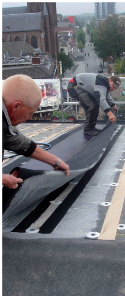
Stap 3: uitklappen van de solarbaan.