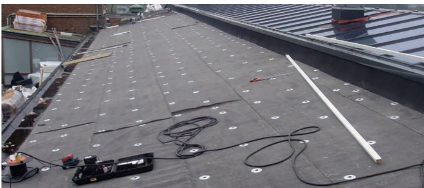
Op de nieuwe isolatielaag is allereerst een laag gebitumineerde polyester mat (260P11) aangebracht.